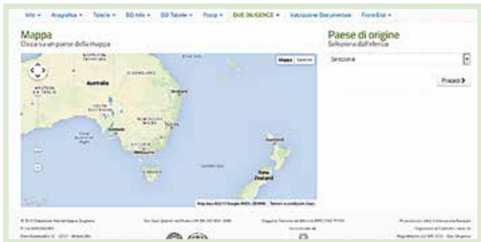
Selezione del Paese di origine