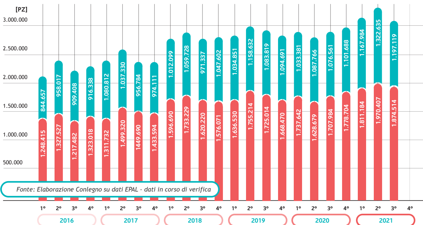
TAB 10: ANDAMENTO PRODUZIONE TRIMESTRALE PALLET EPAL (NUOVI + RIPARATI)