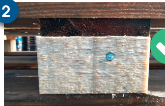
BLOQUE CENTRAL NO MARCADO BLOC CENTRAL NEUTRU