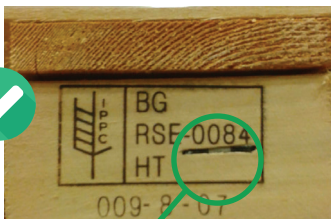
GRAPA NEGRA CLEMĂ NEAGRĂ