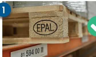
BLOQUE DE AGLOMERADO BLOC DIN RUMEGUȘ