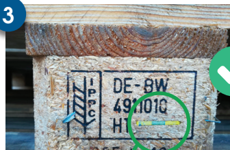
GRAPA AMARILLA CLEMĂ GALBENĂ