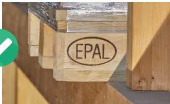
BLOQUE DE MADERA BLOC DIN LEMN