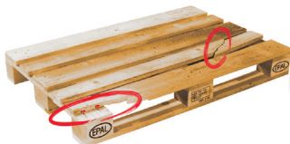
Più di 2 tavole sono rotte