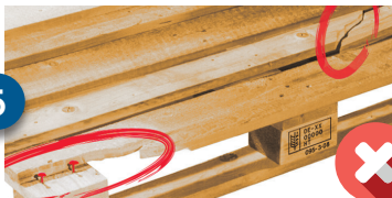
More than 2 broken deck boards