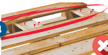
Missing deck board