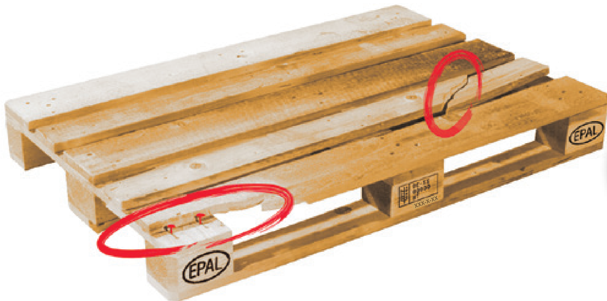
Más de 2 tablas están rotas