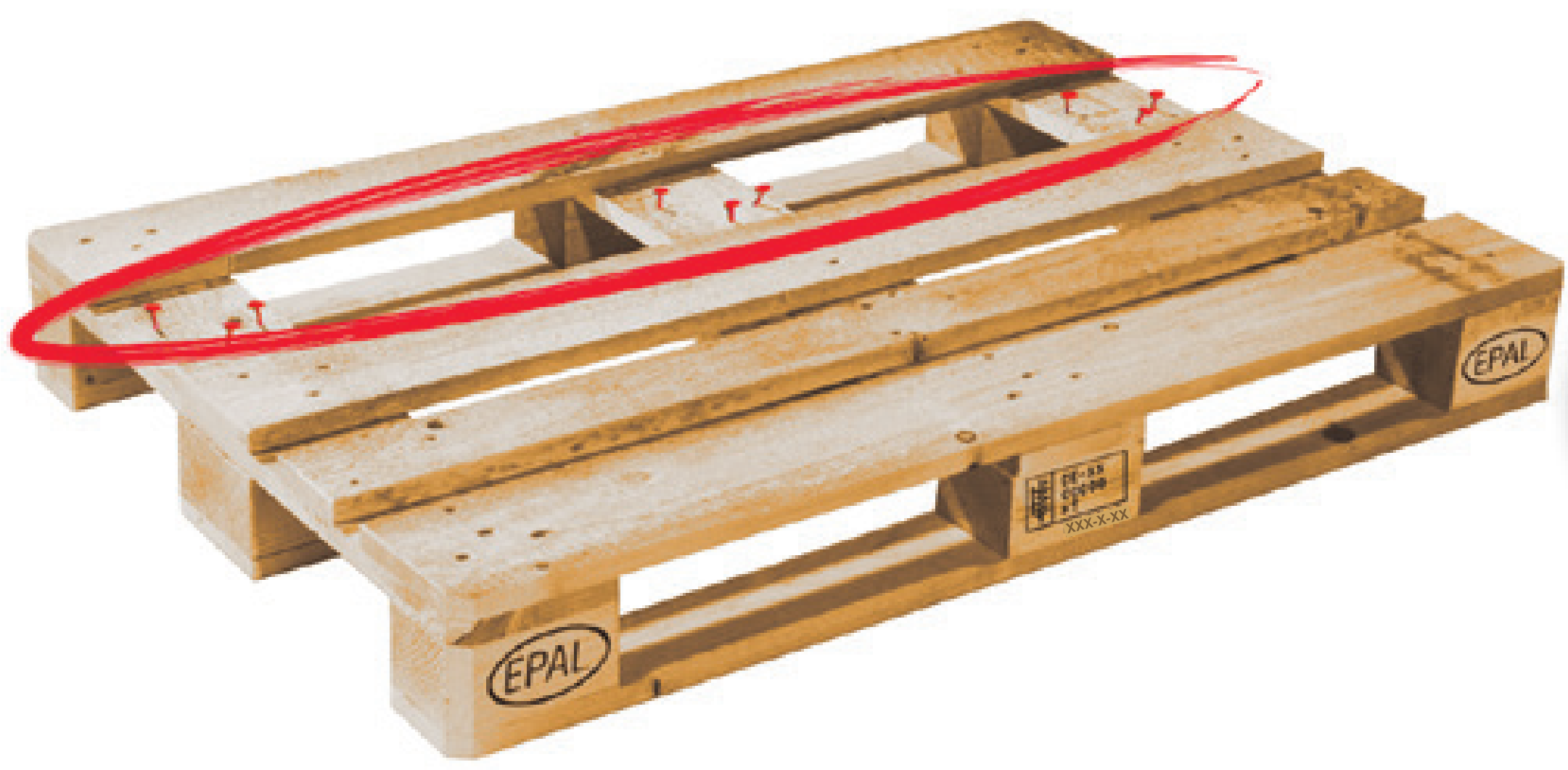
Falta una tabla