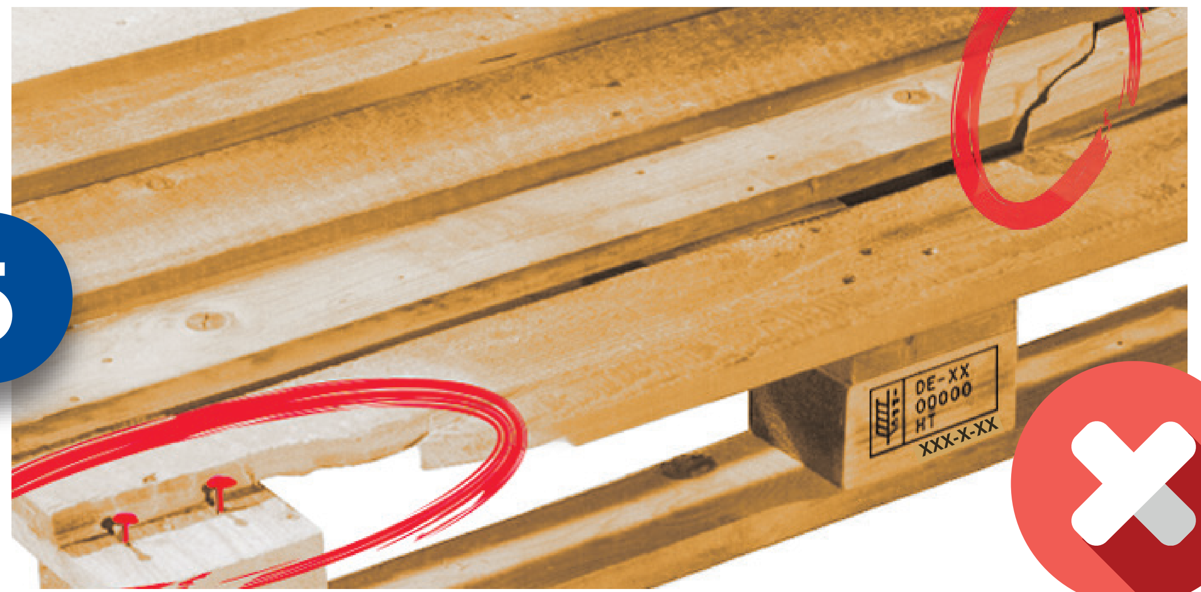
Mai mult de 2 scânduri sunt rupte