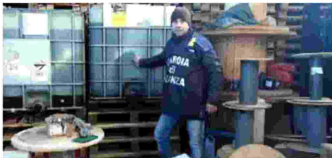
I pallet irregolari sequestrati dalla Guardia di Finanza

I militari delle Fiamme Gialle hanno accertato che la società operava senza le previste autorizzazioni. L'attività dei finanzieri ha portato al sequestro di oltre 57mila prodotti,